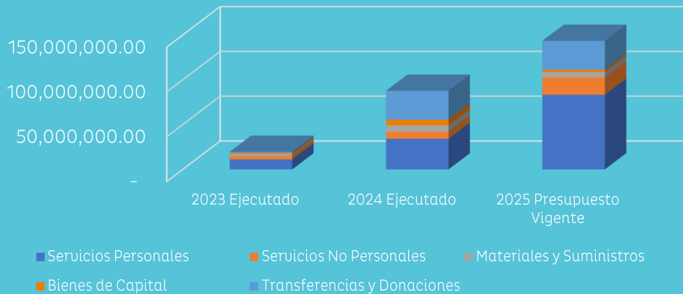
Gráfico No.2 Gasto por Grupo Ejecutado 2023- 2024-Vigente 2025