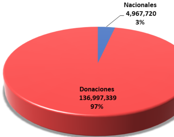
Gráfico No. 6 Fuente de Financiamiento Presupuesto Vigente Ajustado Cifras en Lempiras