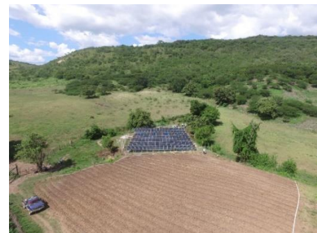
Ilustración 10 del Parque Fotovoltaico del GPA Cosecha #2

Finalmente, el CAPDAH(C-10), ha recibido un desembolso de 76,119,017.91 Lempiras desde noviembre 2019 hasta la fecha.