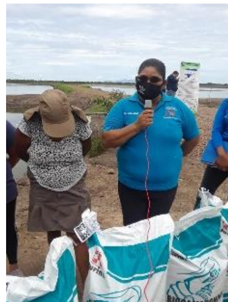
Ilustración 9 Entrega de Alimento para Camarón