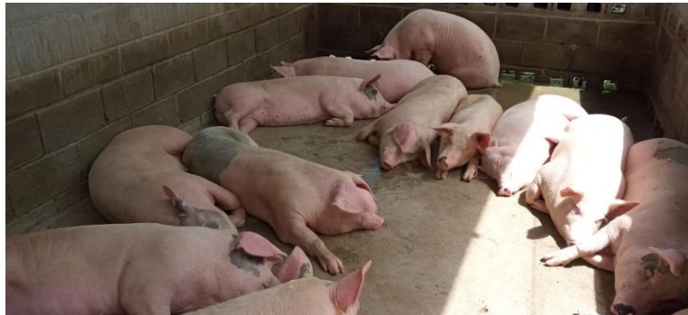
Ilustración 4 Producción de Lechones de Engorde del GPA Cañada Galana

Uno de los Productores Agropecuarios (GPA), que está siendo beneficiado en Especies Menores es el GPA Cañada Galana, del Municipio de Yocón, Departamento de Olancho, el proyecto consta de la construcción de una porqueriza con el sistema de abastecimiento de agua y comederos instalados, dotación de un lote de cerdos, lechones destinados para engorde y para pie de cría, insumos y materiales necesarios (concentrado de crecimiento, concentrado de desarrollo, concentrado final, desparasitantes, vacunas, antibióticos, desinfectantes, vitaminas y minerales, comederos y bebederos de niple para la implementación del proyecto.