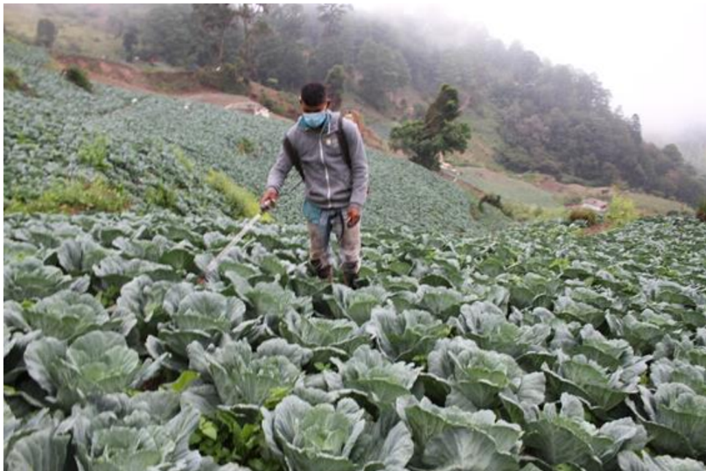
Ilustración 1: Producción de repollo del GPA Montaña Grande

El Comando de Apoyo al Programa de Desarrollo Agrícola de Honduras CAPDAH (C-10), en su misión de estructurar, ejecutar y administrar el Programa de Desarrollo Agrícola, para apoyar directamente a las instituciones del Sector Público Agrícola en la atención a los Grupos de Productores Agropecuarios que están en la línea de pobreza, mediante la inversión directa en capacitación, activos productivos y asistencia técnica para aumentar la productividad y rentabilidad, con el fin de generar mejores condiciones de vida, contribuyendo con la seguridad alimentaria y la reducción sostenible de la pobreza rural.