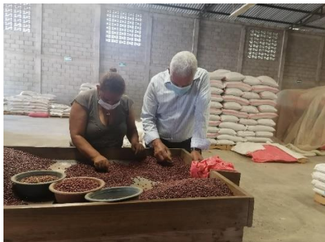
Ilustración 2 Limpieza de Frijoles del GPA ARSAGRO