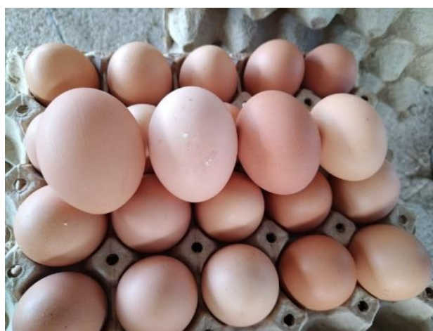
Ilustración 7 Producción de Huevos GPA Lazos de Amistad

Cabe destacar, que el Comando de Apoyo al Programa de Desarrollo Agrícola de Honduras, trabaja con los Grupos de Productores Agropecuarios que se encuentran en la línea de pobreza y que nunca han recibido ningún tipo de apoyo de ninguna institución.