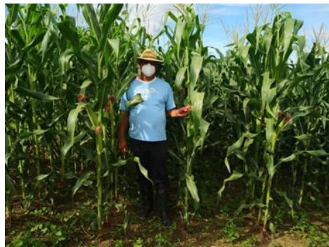
Ilustración 3 Producción de Maíz del GPA ARSAGRO