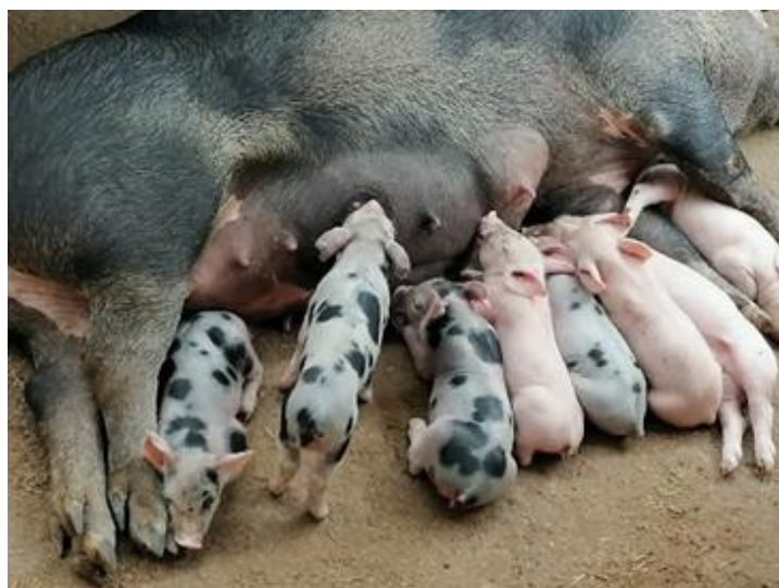
Ilustración 5 Cerdos en Etapa de Crecimiento del GPA Cañada Galana

Cabe destacar que la producción de carne de cerdo de este Grupo de Productores Agropecuarios fue de Diecinueve mil seiscientos cincuenta y dos Libras (19,652 libras), Ingresos por comercialización de carne es Cuatrocientos treinta y dos mil trescientos cuarenta y cuatro lempiras exactos (432,344.00), Lechones Producidos teniendo un valor comercial de Cuarenta y Ocho Mil Lempiras Exactos (48,000.00).