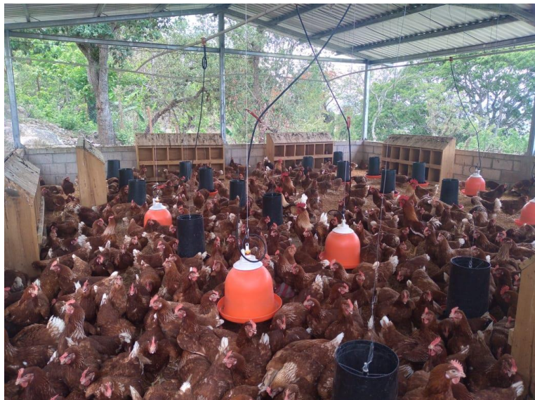
Ilustración 6 Gallinas Ponedoras GPA. Mujeres Unidas en Acción

Entre los Grupos de Productores Agropecuarios beneficiados con Gallinas Ponedoras esta la Empresa de Servicios Múltiples Mujeres Campesinas en Acción ubicadas en Municipio de Gracias, Departamento de Lempira, quienes se les brindó el apoyo en la Construcción de un galpón para gallinas ponedoras y compra de insumos para alimentación y medicamentos, así como gallos reproductores para pie de cría.