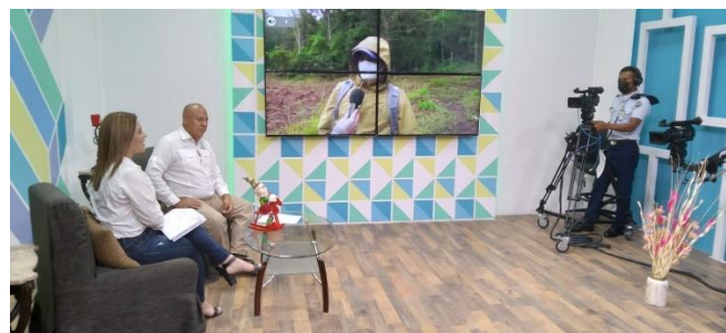
Ilustración 12 Set de Televisión donde se transmite el Programa Cultivando la Tierra Sembramos Vida

Además, el Comando de Apoyo al Programa de Desarrollo Agrícola de Honduras CAPDAH(C-10) trabajará este año con obras menores orientadas a transformación y valor agregado (bodegas para ventas de insumos, ventas de granos, pequeñas infraestructuras) y asistencia técnica Integral (incluye costo de administración) y con el compromiso de ejecutar responsablemente los Recursos Financieros asignados al Programa.