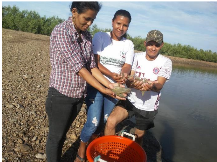
Ilustración 8 Producción de Camarón del GPA. Mujeres Unidas de Guamerú

Un total de 58 miembros de la Caja Rural de Ahorro y Crédito (CRAC) Mujeres Unidas de Guamerú, Costa Azul del Municipio Namasigue, Departamento de Choluteca, fueron beneficiados por el Comando de Apoyo al Programa de Desarrollo Agrícola de Honduras CAPDAH(C-10), con el proyecto Habilitación del sistema de bombeo de agua para lagunas de cultivo de camarones consistiendo en la reparación de motor para el sistema de circulación de agua para mejorar la oxigenación de 3 lagunas para cultivo de camarón, dotación de insumos para alimento de camarón (concentrado) para optimizar la operación productiva de cría y comercialización de camarón.