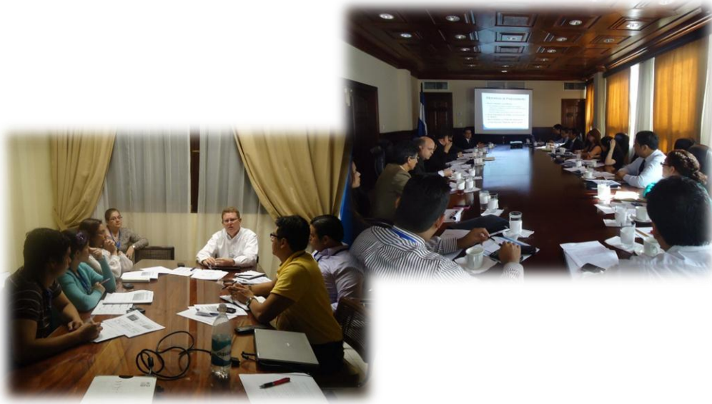
Reuniones varias Dpto. de EERDP