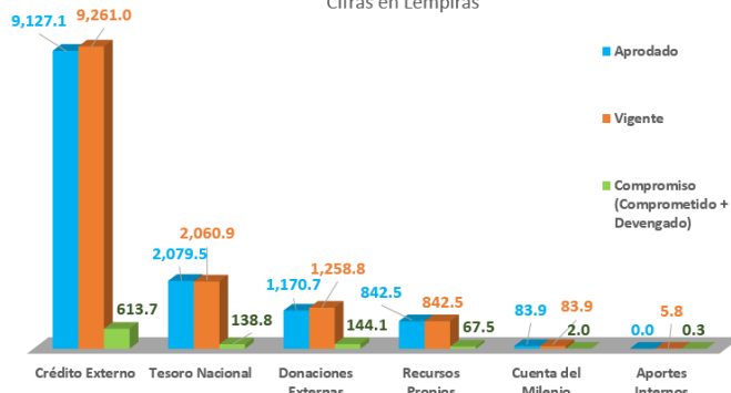
Gráfico No. 2 Programa de Inversión Pública por Fuente al 6 de Marzo de 2015 Cifras en Lempiras

El 21.5% del Programa de Inversión Pública Vigente es financiado con Fondos Nacionales y 78.5% con Fondos Externos, principalmente con recursos provenientes del BID, BCIE, BM, Unión Europea, Austria, OFID, entre otros.