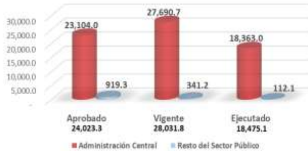
Gráfico No. 2 Inversión Pública por Estructura del Sector Público Porcentaje de Ejecución 66% Cifras en Millones de Lempiras

Los proyectos ejecutados bajo la modalidad de Fideicomisos, siendo el Fideicomiso Fondo Social Reducción de la Pobreza el de mayor monto vigente de inversión (L6,220.0 millones) abarcando el 23.% del total de presupuesto vigente, seguido por los fideicomisos de Infraestructura Vial y los proyectos ejecutados bajo la modalidad Alianzas Público Privadas sumando en su conjunto L6,044.9 millones representativos del 21.6% del presupuesto Vigente; en su conjunto los proyectos ejecutados bajo la modalidad de Fideicomisos y Asociaciones Público Privadas, absorben una inversión de L13,050.7 millones (48.8%) del total de la inversión pública.