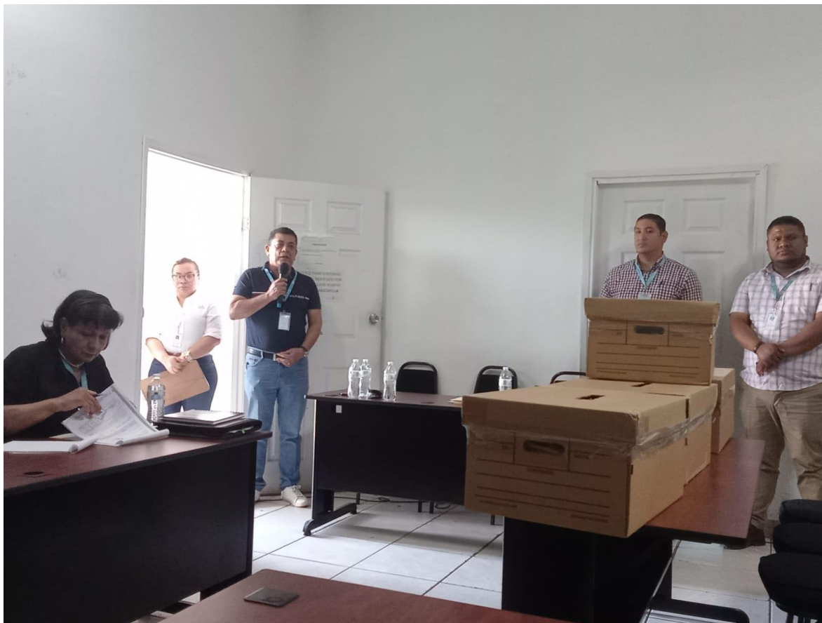
Miembros del comité de subastas

Siguiendo los lineamientos de Ley de Contratación del Estado