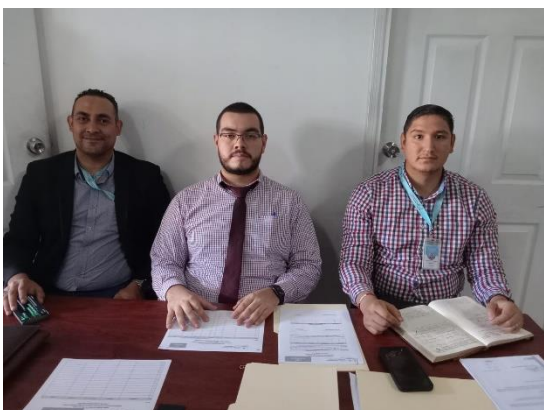
Mesa de recepción de documentos

La Dirección Nacional de Bienes del Estado, entidad desconcentrada, de la Secretaría de Finanzas, en el cumplimiento de sus funciones y atribuciones e implementando las medidas de optimización de los recursos dispuesto por el Gobierno de la República, coordinó el día 16 de febrero del presente año con la Alcaldía Municipal del Distrito Central (AMDC), Subasta No. AMDC-BM-001-2024 , de vehículos y equipo pesado en mal estado.