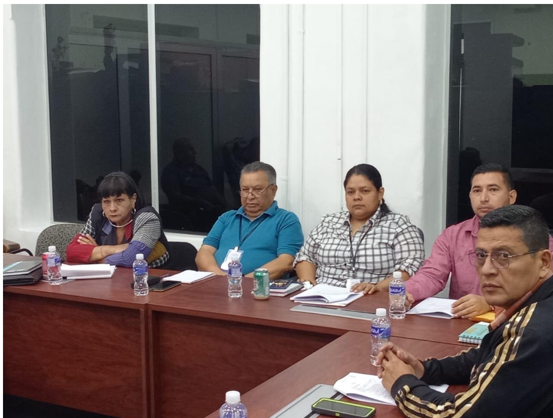
Miembros del comité de subastas

Siguiendo los lineamientos de Ley de Contratación del Estado