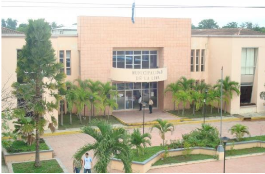
Alcaldía Municipal de La Lima.

La AML, tiene como misión, establecer una administración Municipal eficiente y efectiva, así como una línea de trabajo orientada a construir el desarrollo sostenible del departamento de Cortés, involucrando la participación activa de la ciudadanía como parte esencial en el progreso del municipio.