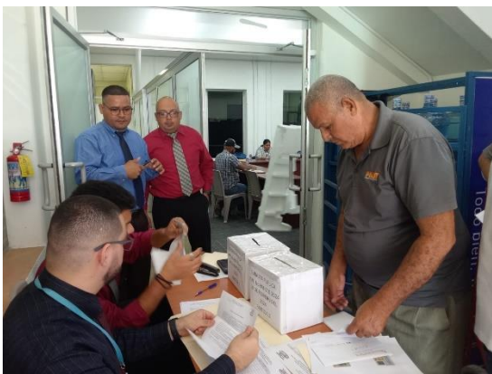
Mesa de recepción de documentos

La Dirección Nacional de Bienes del Estado (DNBE), entidad desconcentrada, de la Secretaría de Finanzas, en el cumplimiento de sus funciones y atribuciones e implementando las medidas de optimización de los recursos dispuesto por el Gobierno de la Republica, coordinó el día 19 de febrero del presente año con la Alcaldía Municipal de la Lima, Cortés, La subasta No. AML-BM-001-2024 , de vehículos, equipo pesado, material ferroso y equipo mobiliario en mal estado.