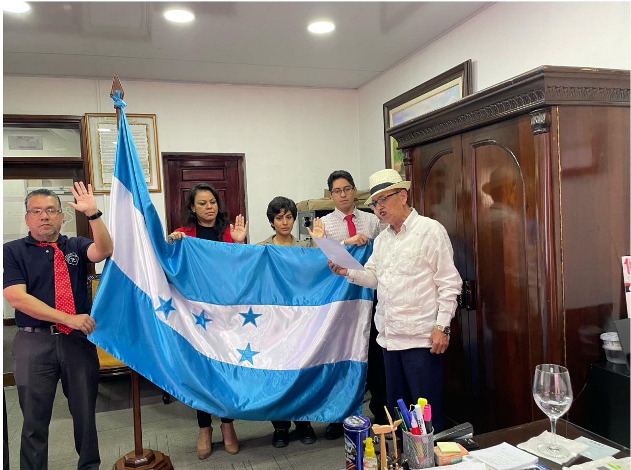
Miembros del Comité de Control Interno (COCOIN).