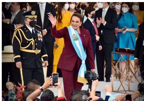
Presidenta de Honduras Xiomara Castro de Zelaya