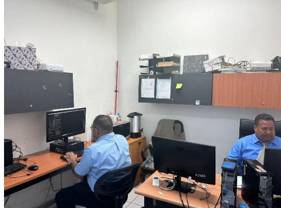
Unidad de Soporte Técnico.