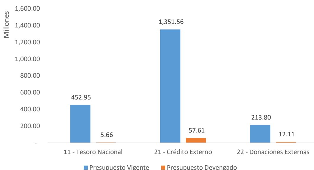
Gráfico No. 1 Fuente de Financiamiento Fondo Hondureño de Inversión Social (FHIS ) Al 31 de marzo 2022-2024 Millones de Lempiras

En referencia al financiamiento de Inversión Pública, el 67.0% corresponde a fondos provenientes de crédito externo expresado en términos monetarios con un monto de L1,351.6 millones , el 22.4% a recursos de recursos nacionales con un monto de L213.8 millones ; y las contrapartes de donaciones externas que ascienden a L12.1 millones equivalente a 10.6%, sumando un monto total en el presupuesto vigente de L2,018.3 Dicha inversión es financiada Recursos Nacionales 22.4% , USAID 4.2% , KfW 9.5% , Banco Mundial 14.8% y BCIE 49.1% .