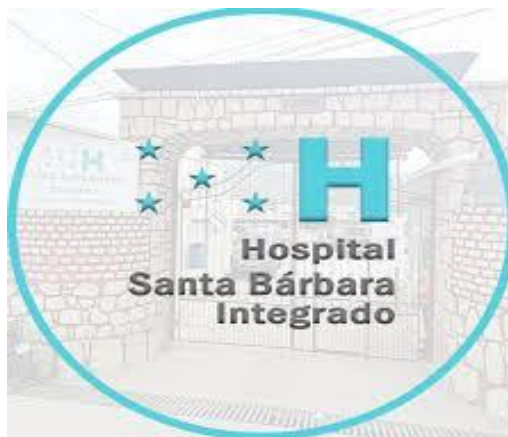
Hospital de Santa Bárbara Integrado, dependiente de la Secretaría de Salud (SESAL).

Al final de la Audiencia de Subasta, se firmó por parte de las Autoridades presentes, el Acta de Apertura de Audiencia Adjudicación de la dicha Subasta.