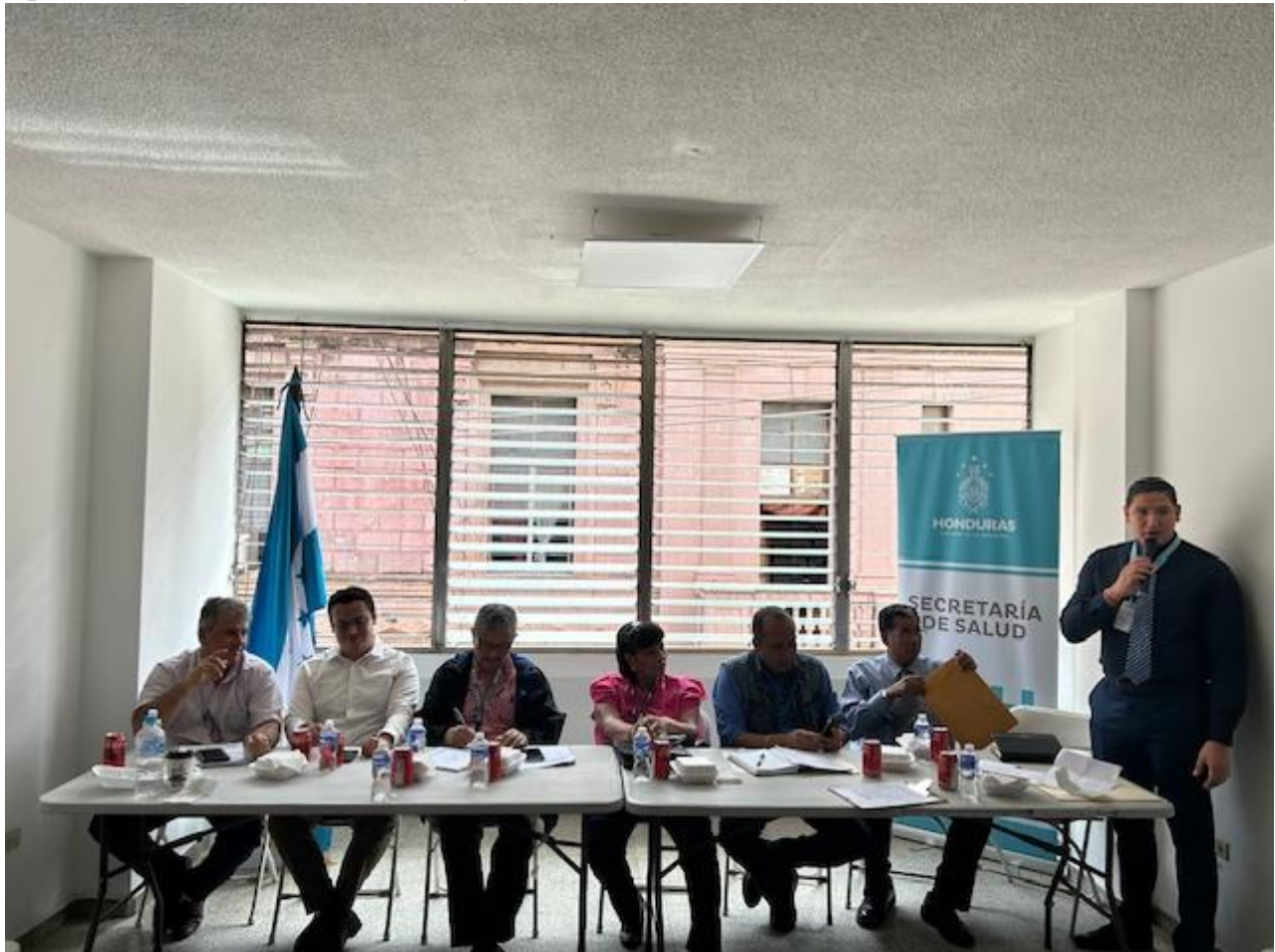
Miembros del comité de subasta.

Siguiendo los lineamientos de Ley de Contratación del Estado