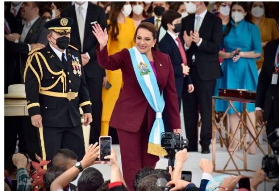
Presidenta de Honduras Xiomara Castro de Zelaya