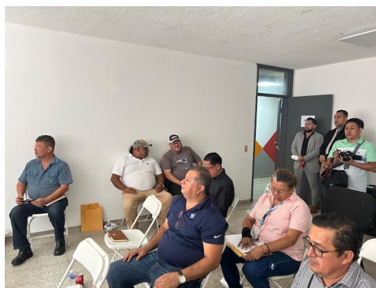
Asistentes a la audiencia de subastas