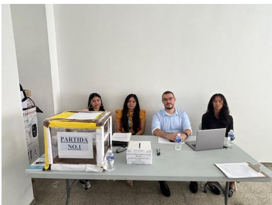
Mesa de recepción de documentos

La Dirección Nacional de Bienes del Estado (DNBE), entidad desconcentrada, de la Secretaría de Finanzas, en el cumplimiento de sus funciones y atribuciones e implementando las medidas de optimización de los recursos dispuesto por el Gobierno de la República, coordinó el día 27 de junio del presente año con El Hospital de Santa Bárbara Integrado, dependiente de la Secretaría de Salud (SESAL), La subasta SESAL No. BM-005-2024 , de equipo médico en mal estado.