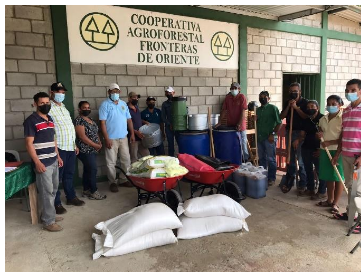
Activos productivos entregados a Grupo de Productores Agropecuarios Cooperativa Agroforestal Fronteras de Oriente.