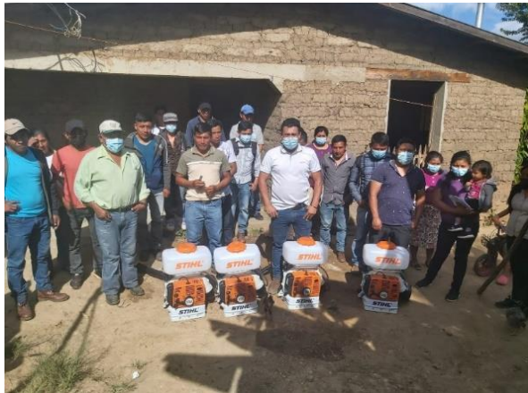
Empresa de Servicios Múltiples El Paraíso Malguara.

Los productores asistidos por el PDAH son del sector organizado y entre ellos se encuentran: Empresa Asociativa Campesina de Producción (EACP), Empresa de Servicios Múltiples (ESM), Asociación de Productores (AP), Cooperativa Agroforestal (CA), Caja de Ahorro y Crédito Rural (CRAC), entre otras.