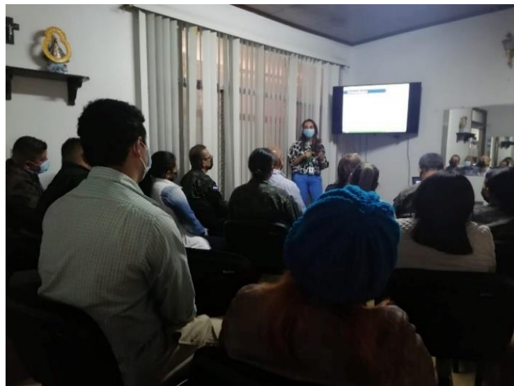
Desarrollo del proceso de capacitación realizado por especialistas del Instituto de Acceso a la Información Pública (IAIP)

Cabe mencionar, que el Comando de Apoyo al Programa de Desarrollo Agrícola de Honduras CAPDAH(C-10), da conocer a través del portal de transparencia de la Secretaria de Finanzas las actividades que realiza con Grupos de Productores Agropecuarios (GPA), que están siendo beneficiados con el apoyo que brinda el Programa.