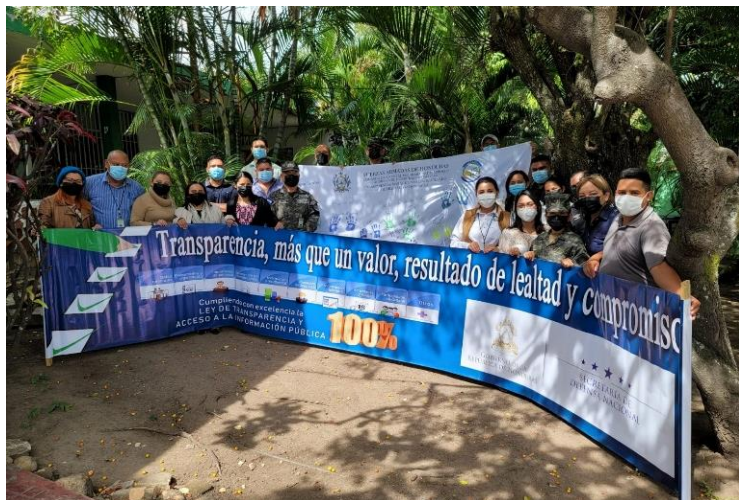
Talento Humano del CAPDAH (C-10) capacitado por IAIP y SEDENA

Miembros del Comando de Apoyo al Programa de Desarrollo Agrícola de Honduras CAPDAH (C-10), fueron capacitados en ética, transparencia, protección de datos personales, acceso a la información, clasificación de información e inversiones públicas y Protección de Datos Personales. por personal del Instituto de Acceso a la Información Pública (IAIP) en Conjunto con la Unidad de Transparencia de la Secretaria de Estado en los Despachos de Defensa Nacional (SEDENA).