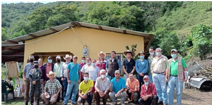
Equipo Técnico Interinstitucional Multidisciplinario (ETIM), coordinado por el CAPDAH (C-10) con miembros de los Grupos de Productores Agropecuarios (GPA) en Santa Bárbara

Equipo Técnico Interinstitucional Multidisciplinario (ETIM), coordinado por el CAPDAH (C-10), realizó visita de campo en el departamento Santa Bárbara, con el objetivo de Socializar el Programa de Desarrollo Agrícola de Honduras (PDAH), levantar encuestas de diagnóstico, reconocer Unidades Productivas y verificar las membresías de los miembros de los Grupos de Productores Agropecuarios (GPA).