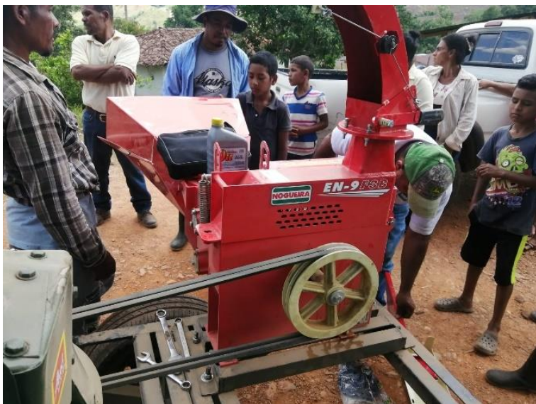
Picadora Nogueira EN-9 F 36 entregada a los GPA que se beneficiaron con Proyectos de Ganado Mayor.

406 Solicitudes de Apoyo recibidas por el CAPDAH (C-10) de Grupos de Productores Agropecuarios (GPA).