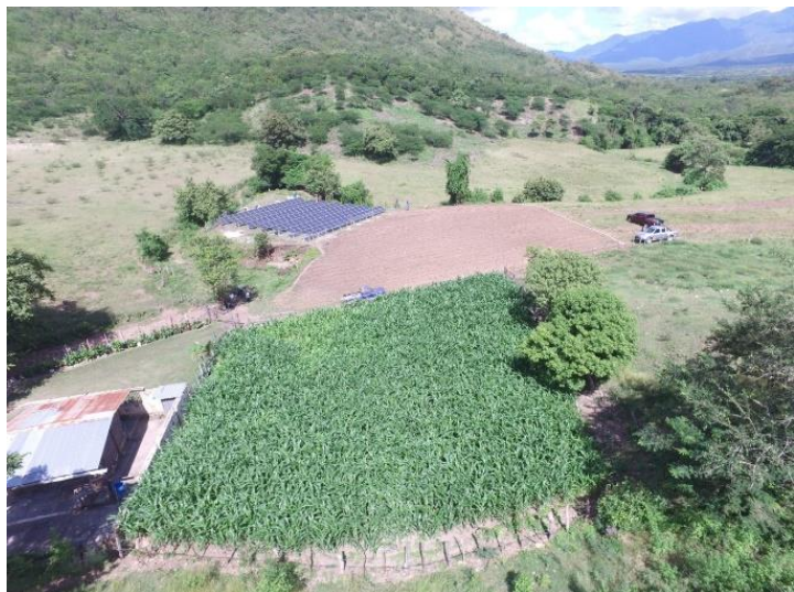
Empresa Asociativa Campesina de Producción Cosecha #2 en Cantarranas, Francisco Morazán.

Con el objetivo de dinamizar la economía local, se llevó a cabo el Proyecto de 4 parques Fotovoltaicos en el municipio de Cantarranas Francisco Morazán, para el fortalecimiento de la competitividad con productores de cultivos de alto valor y granos que beneficiará a tres Grupos Productores Agropecuarios (GPA): Empresa Asociativa Campesina de Producción Cosecha #1, Empresa Asociativa Campesina de Producción Cosecha #2 y Empresa Asociativa Campesina de Producción Juventud Valiente.