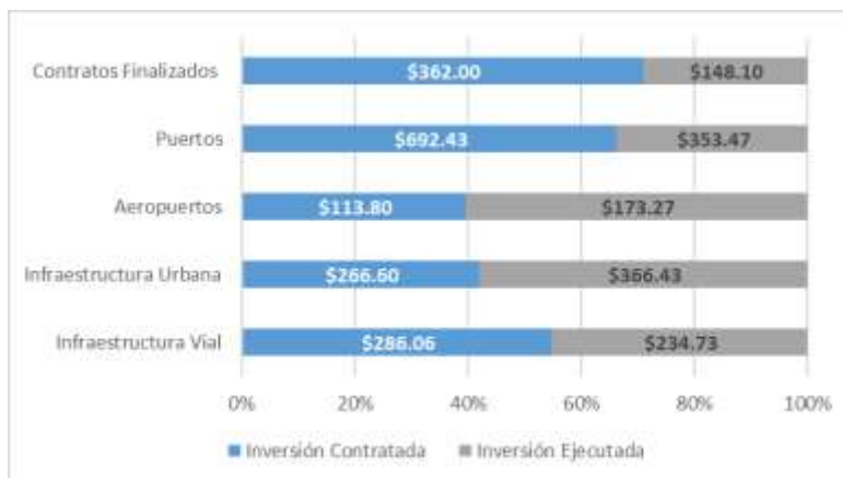
Gráfico 2 Inversión de proyectos App's por sector En millones de dólares